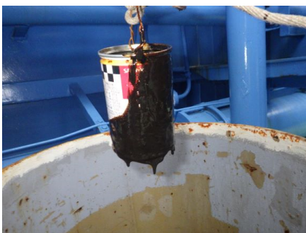
▲「白山」油水槽に回収した流出油