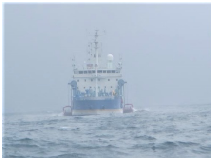
▲油回収作業状況（「白山」正面）