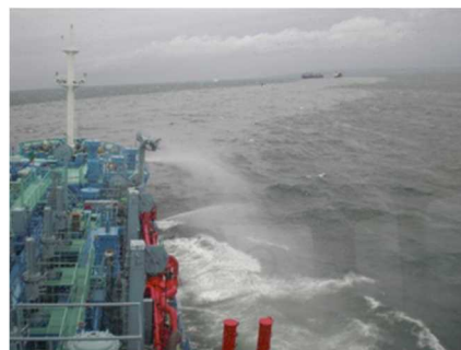
▲航走及び放水拡散状況(「白山」船上から)