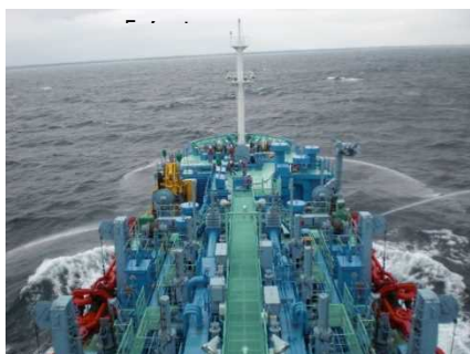
▲航走及び放水拡散状況(「白山」船上から)