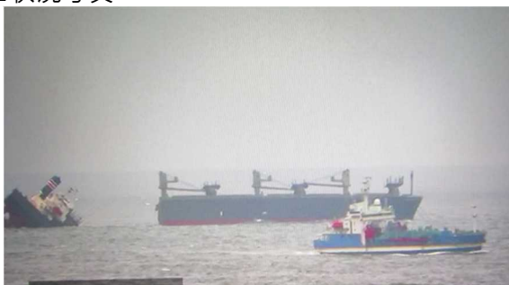
▲航走及び放水拡散作業状況(右手前「白山」)