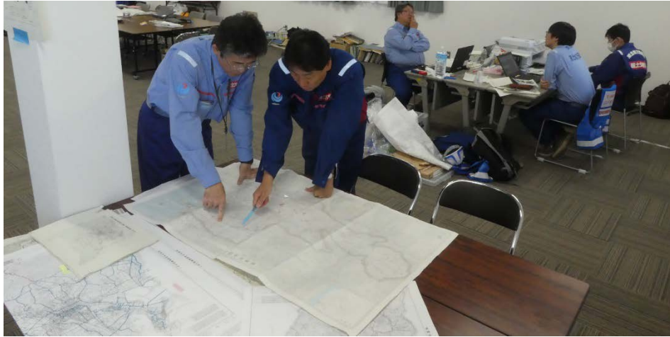
河川班の調査状況を確認 (福島県相馬市 相馬市役所 分庁舎)