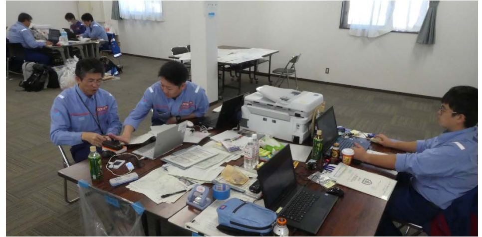
各地整の調査報告書 取りまとめ作業 (福島県相馬市 相馬市役所 分庁舎)