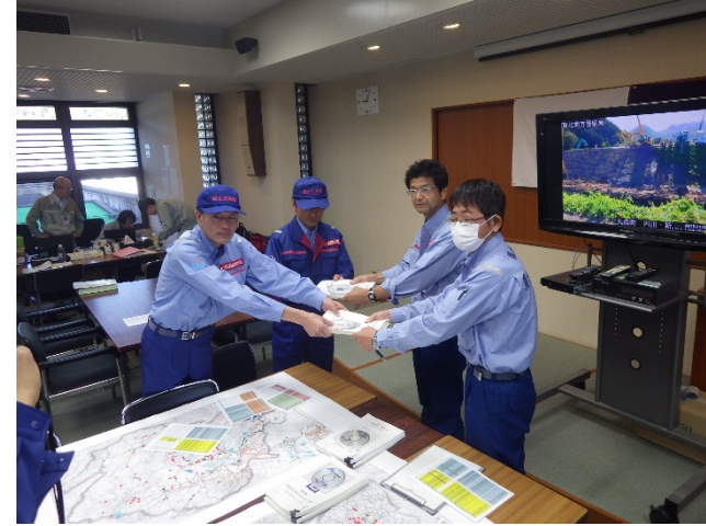
北海道開発局からの調査完了報告状況(宮城県丸森町役場内 )