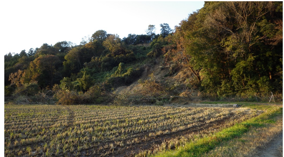
南相馬市原町区上太田堰場地内 河道閉塞箇所および法面崩落状況