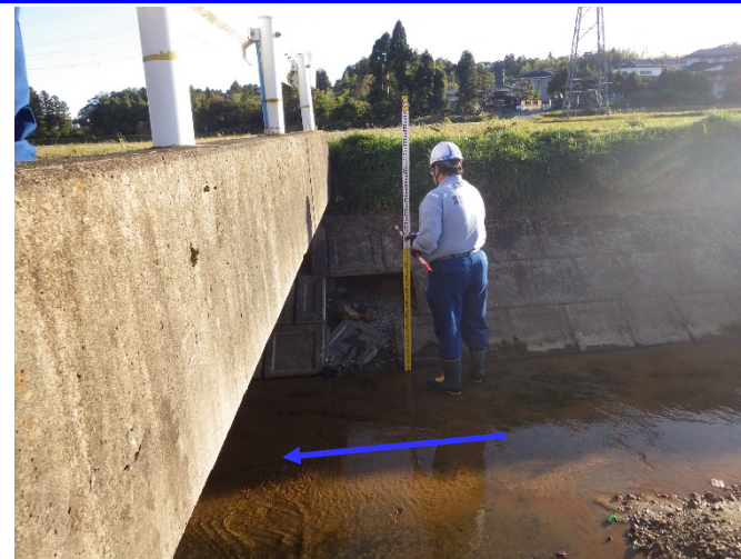
被災状況調査(護岸ブロック空洞化、歯抜) (福島県相馬市 宇多川左二次支川)