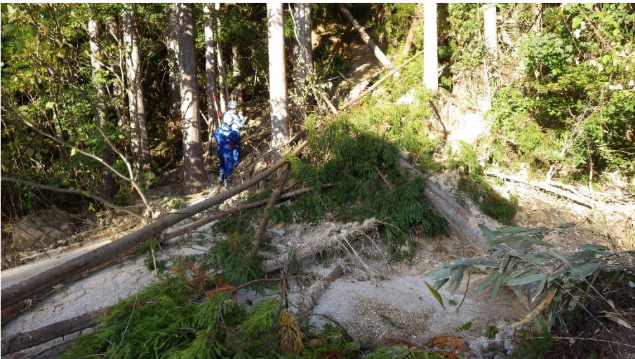
南相馬市原町区馬場石住地内 河道閉塞および法面崩落状況