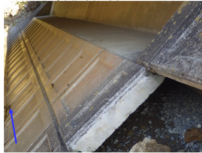
被災状況調査(護岸ブロック空洞化、歯抜) (福島県相馬市 宇多川左二次支川)