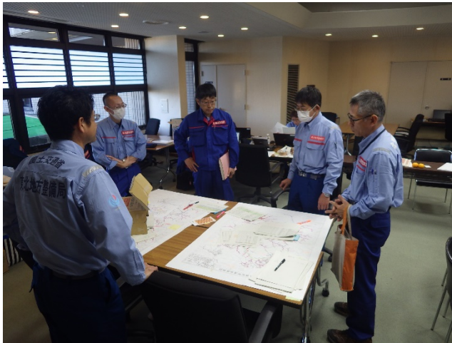
調査隊到着後報告・打合せ状況(宮城県丸森町役場内 )