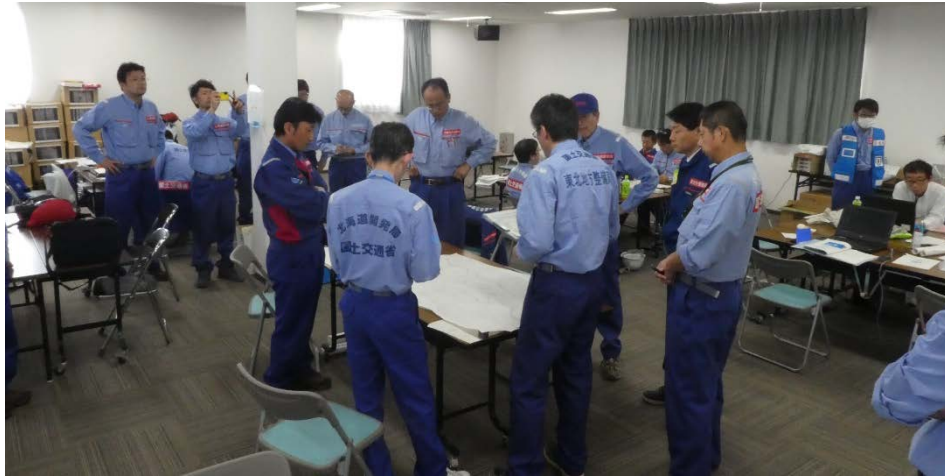
各地整 班長会議：午後の調査計画を確認 (福島県相馬市 相馬市役所 分庁舎)