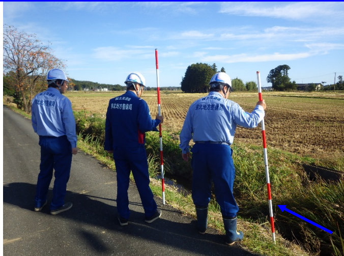
被災状況調査 (福島県相馬市 立谷川)