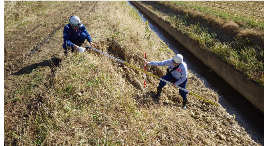
南相馬市原町区上北高平西高松地内 法面崩落状況