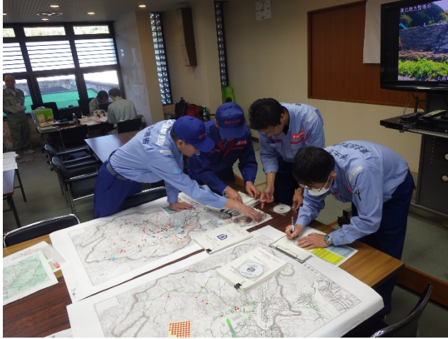
北海道開発局からの調査完了報告状況(宮城県丸森町役場内 )