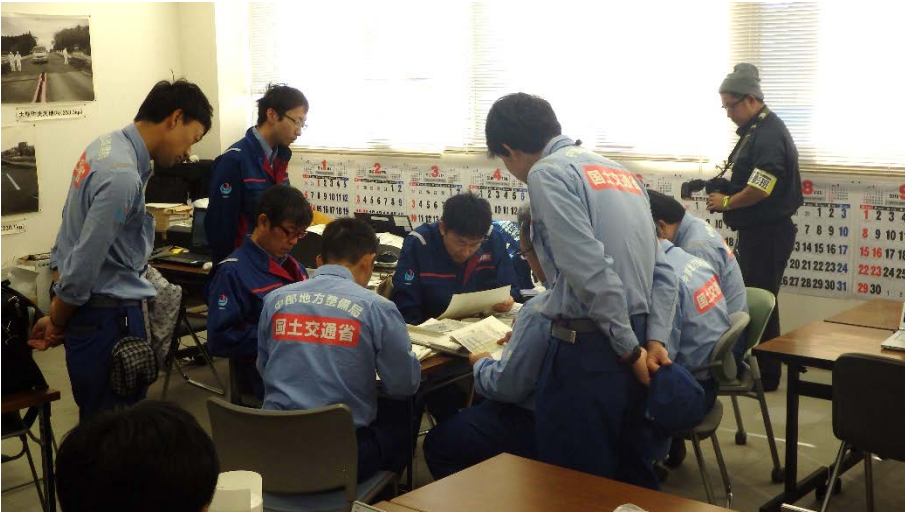
原町除雪ステーション内 班長会議状況