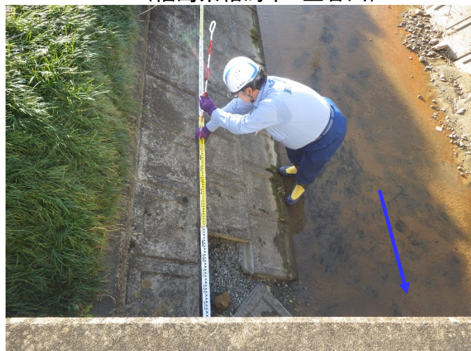
被災状況調査(護岸ブロック空洞化、歯抜) (福島県相馬市 宇多川左二次支川)