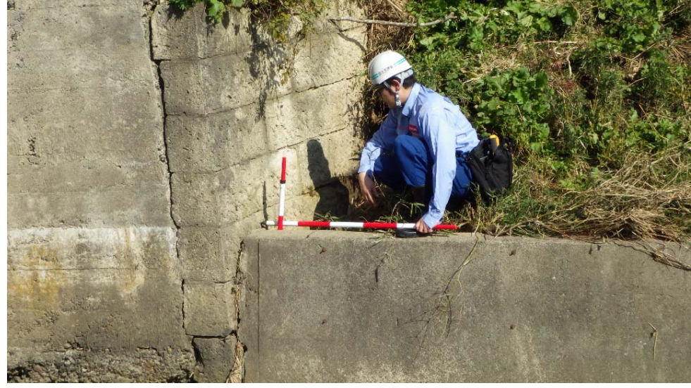
水路橋橋台と護岸の確認(南相馬市原町区上北高平北沢地内)