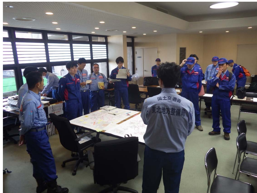
現地調査前ミーティング状況(宮城県丸森町役場内)