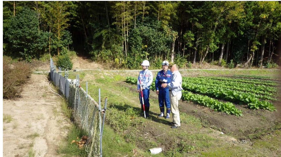
地域住民から情報収集状況(南相馬市原町区泉根渡地内)