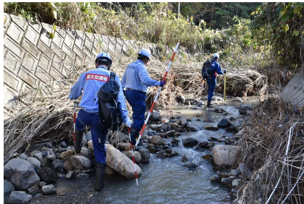
被災状況調査(福島県相馬市 町場川)