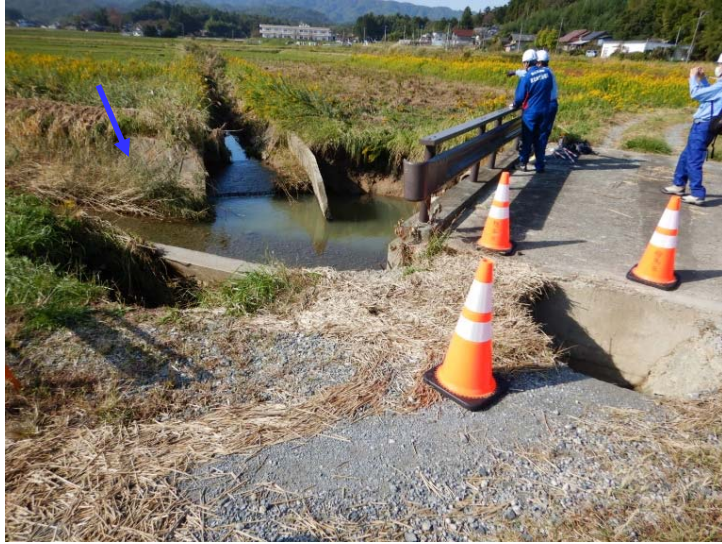
被災状況調査(左岸起点部護岸崩落) (福島県相馬市 日下石川左支川)