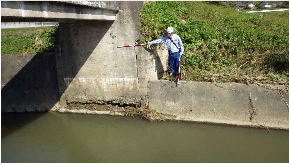
水路橋橋台下部損傷状況(南相馬市原町区上北高平北沢地内)