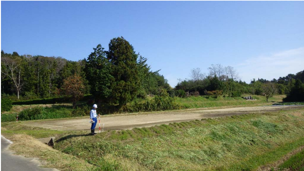
農地へ土砂の流入および堆積状況(南相馬市原町区下北高平荷渡地内)