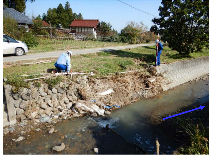
被災状況調査(左岸河岸崩落) (福島県相馬市 町場川)