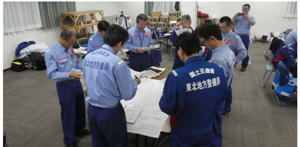
各地整 班長会議：進捗状況を確認 (福島県相馬市 相馬市役所 分庁舎)