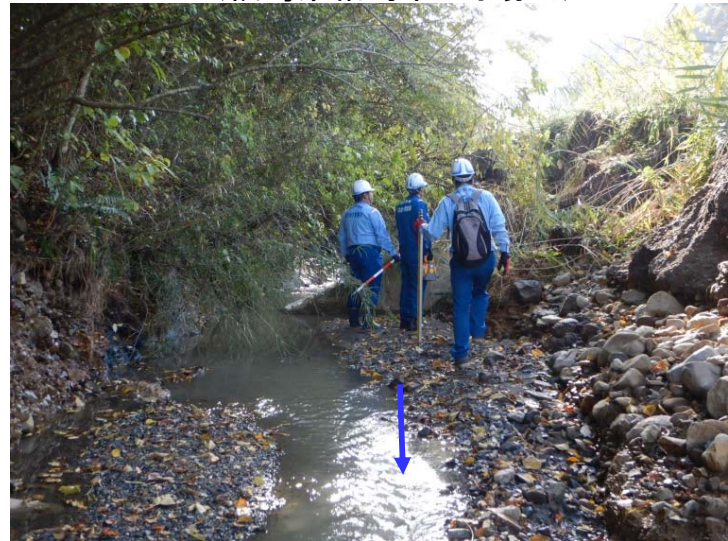
被災状況調査(左岸側擁壁崩落) (福島県相馬市 町場川)