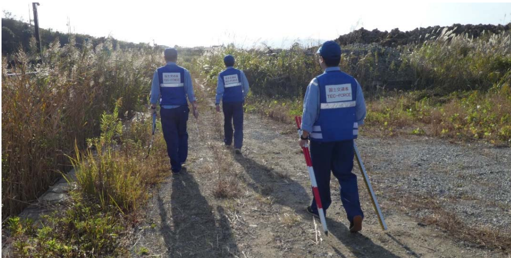
被災状況調査を実施 (福島県相馬市 市道1087号線)