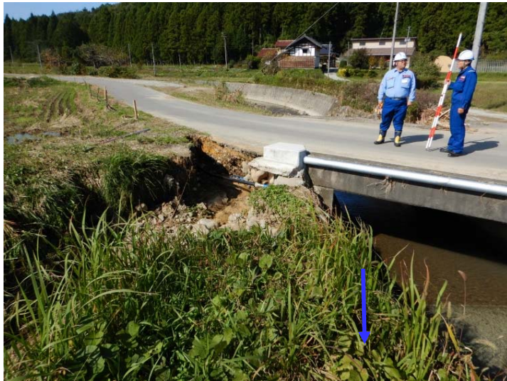
被災状況調査(右岸側河岸・路側洗掘) (福島県相馬市 町場川)