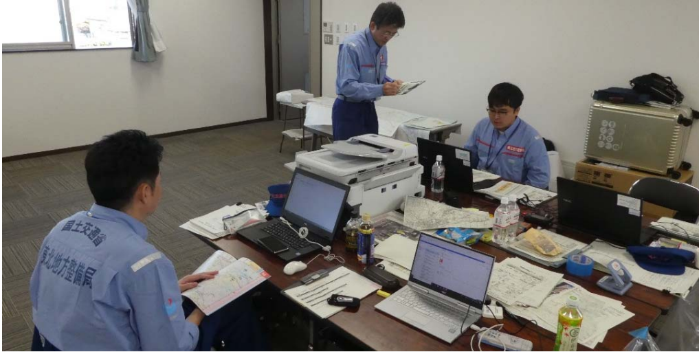
調査の進捗管理作業 (福島県相馬市 相馬市役所 分庁舎)