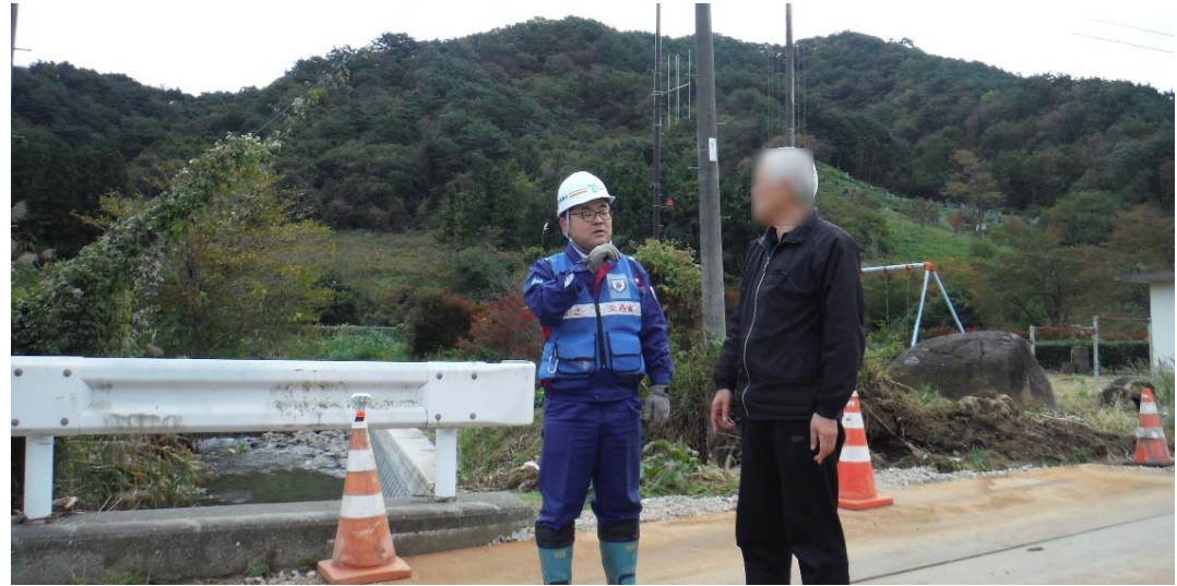
被災状況調査状況 (福島県相馬市 市道1-24 副霊山線)