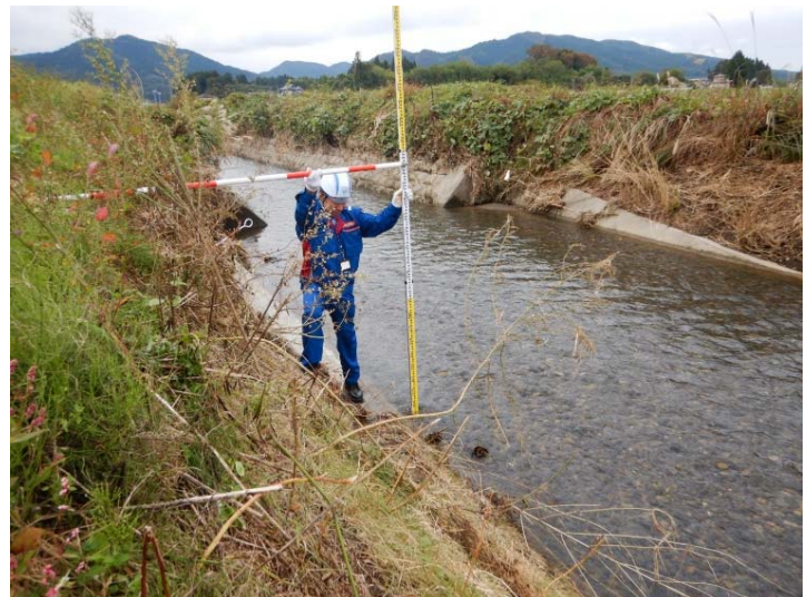
被災状況調査状況 (福島県白河市 坂下川)