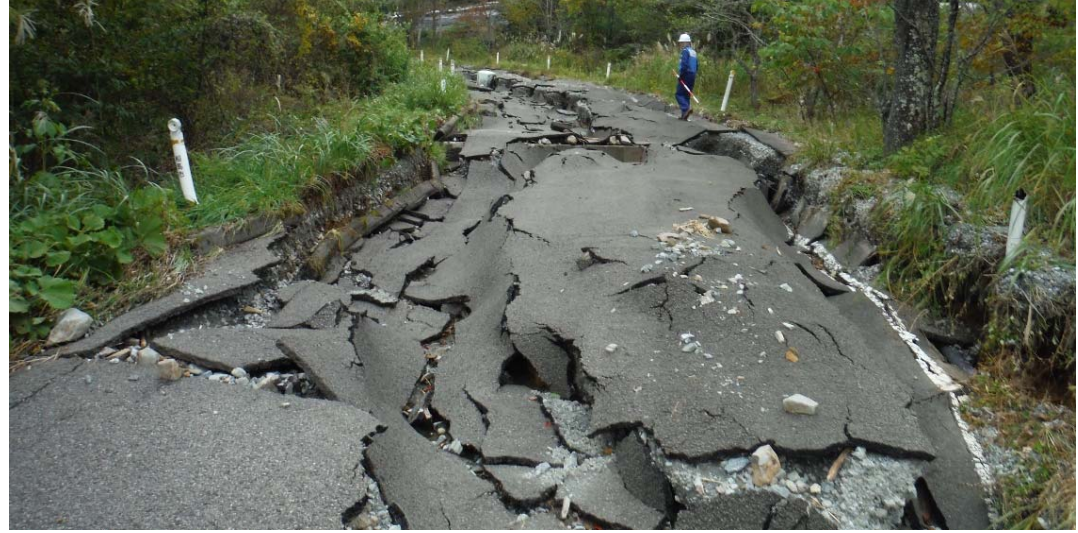
被災状況調査状況 (福島県相馬市 市道3064号)