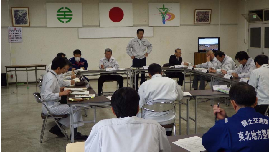
矢吹町災害対策本部会議の状況