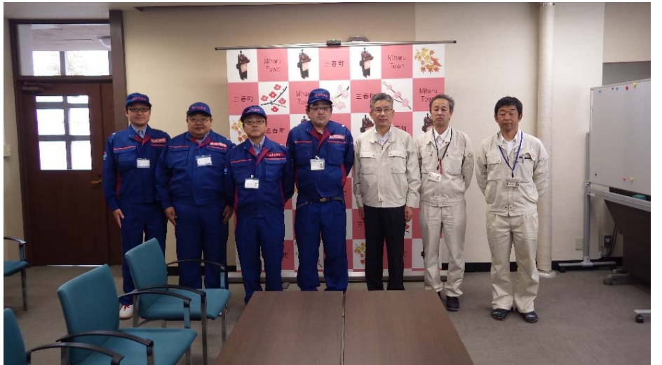
町長と撮影 福島県田村郡三春町