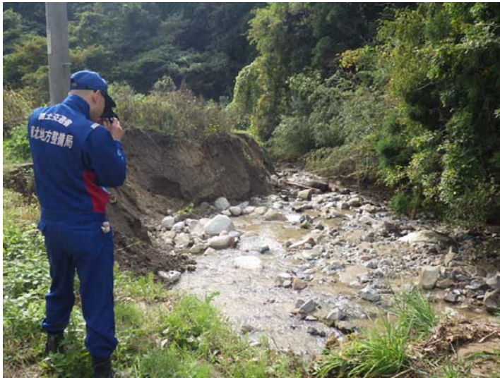
被災状況調査状況(調査①) 宮城県角田市 北山の内川 被災状況(レーザー計測)