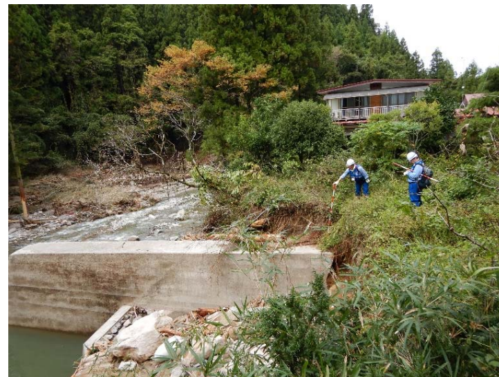
復旧対策に向けた調査状況 (宮城県丸森町 五福谷川堰堤付近)