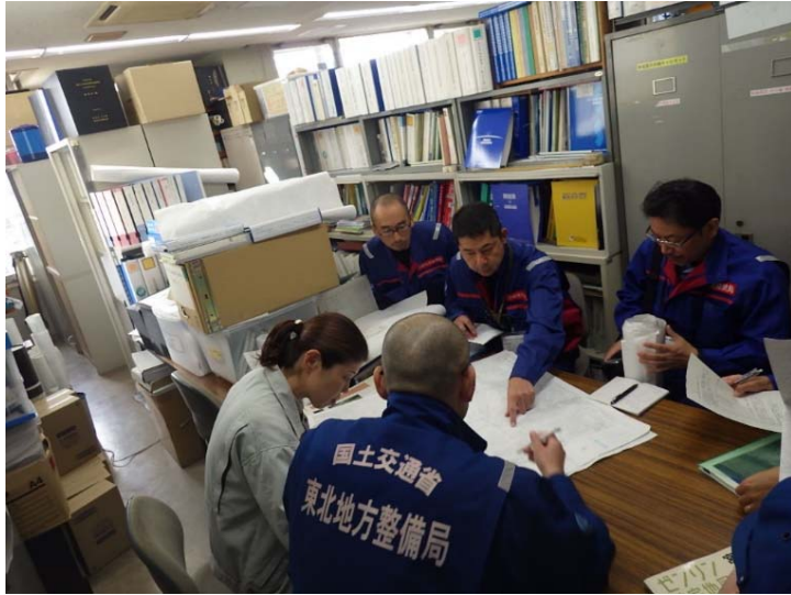
宮城県角田市役所及び他地整テックフォースと打合せ