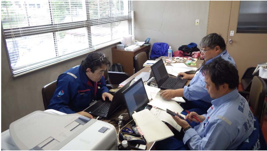
資料整理 福島県田村郡三春町