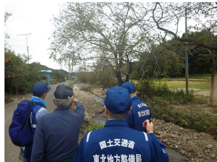
被災状況調査状況(調査①) 宮城県角田市 尾袋川 被災状況(住民から情報収集)