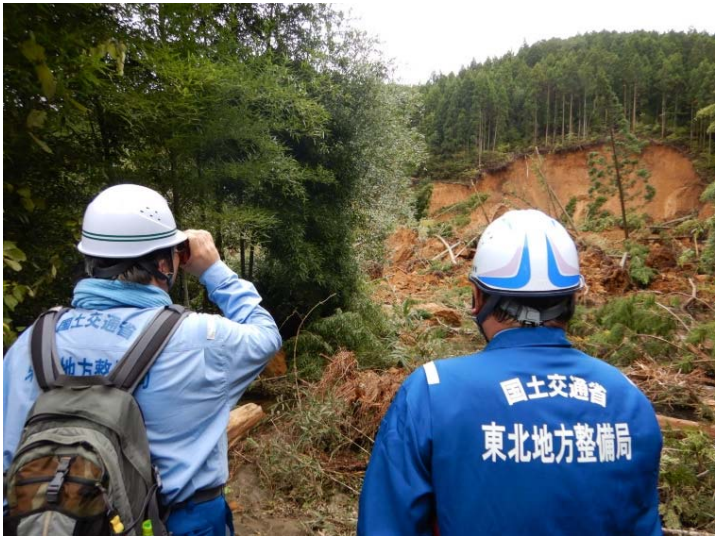
被災状況調査状況(レーザー測距儀による計測) (福島県白河市 坂下川)