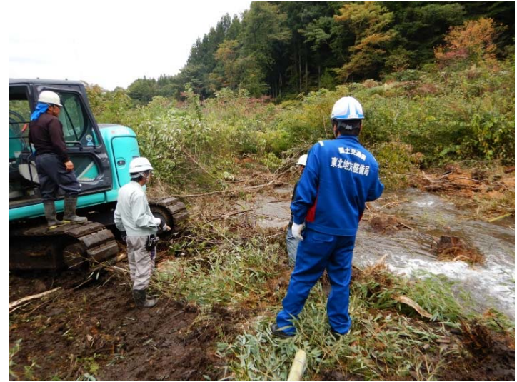
復旧作業業者からの聞き込み (福島県白河市 坂下川)