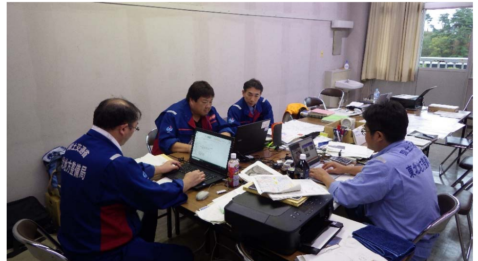
現地調査結果とりまとめ作業