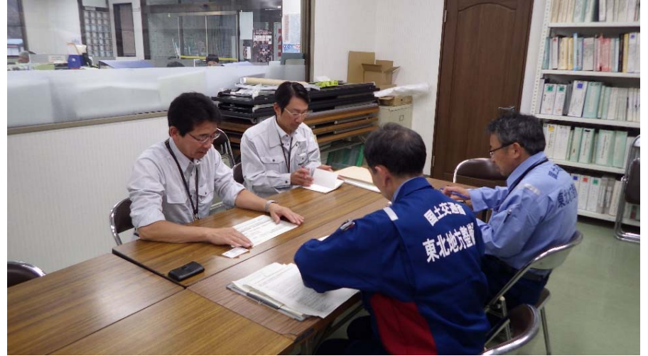
今回の災害に伴う建設業法の特例措置の内容説明