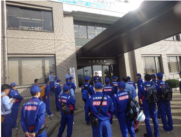
全体ミーティング状況 (宮城県丸森町役場前)