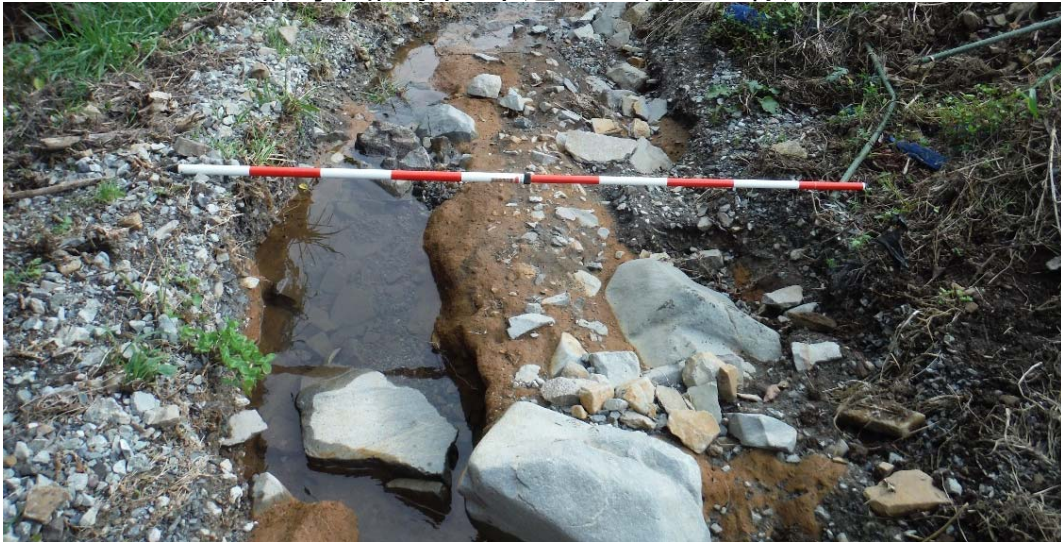
被災状況調査状況 (福島県相馬市 市道3067号)