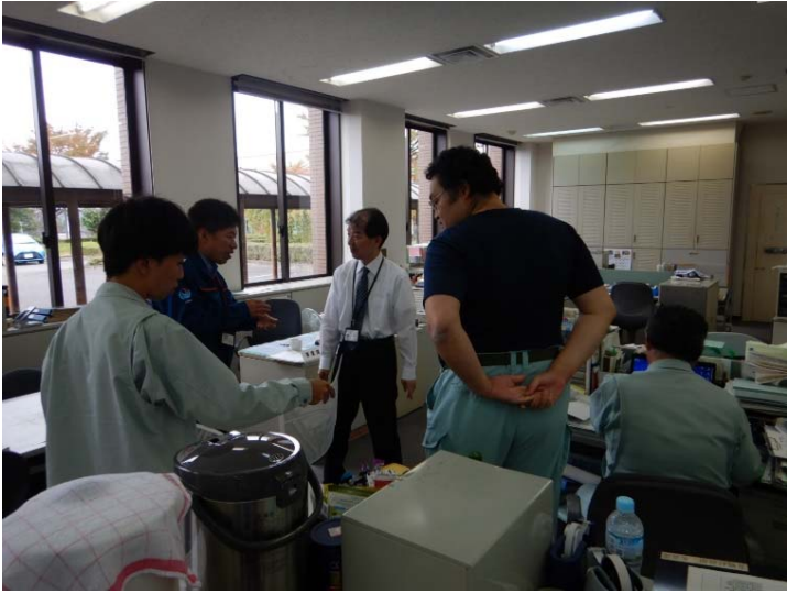
関係者との打合せ (福島県白河市表郷庁舎)