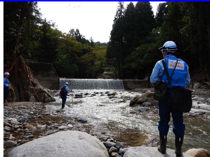
復旧対策に向けた調査状況 (宮城県丸森町 五福谷川堰堤付近)