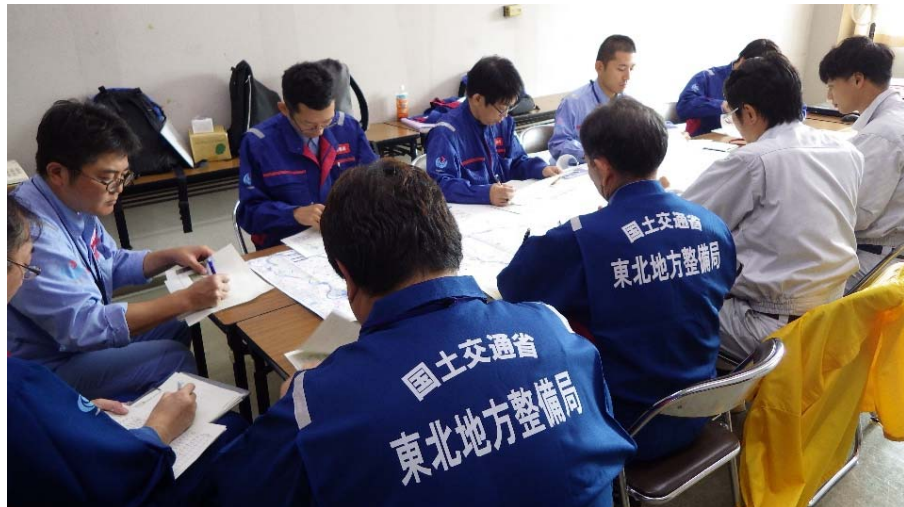
近畿TECが到着 現時点までの秋田TEC1班の調査状況の情報共有を行った