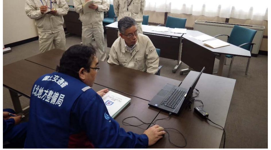
調査結果について町長へ説明 福島県田村郡三春町