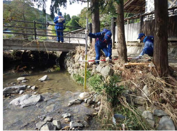
被災状況調査状況(調査①) 宮城県角田市 北山の内川 被災状況(河岸洗掘)