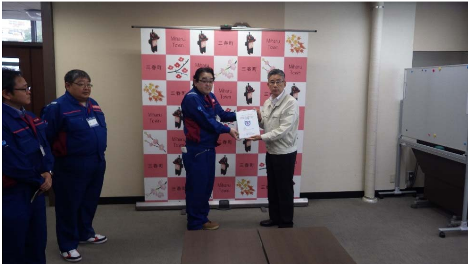
調査報告書を町長へ引き渡し 福島県田村郡三春町