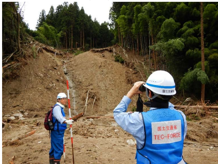
復旧対策に向けた調査状況(ICTを活用) (宮城県丸森町 五福谷川薄平地区)