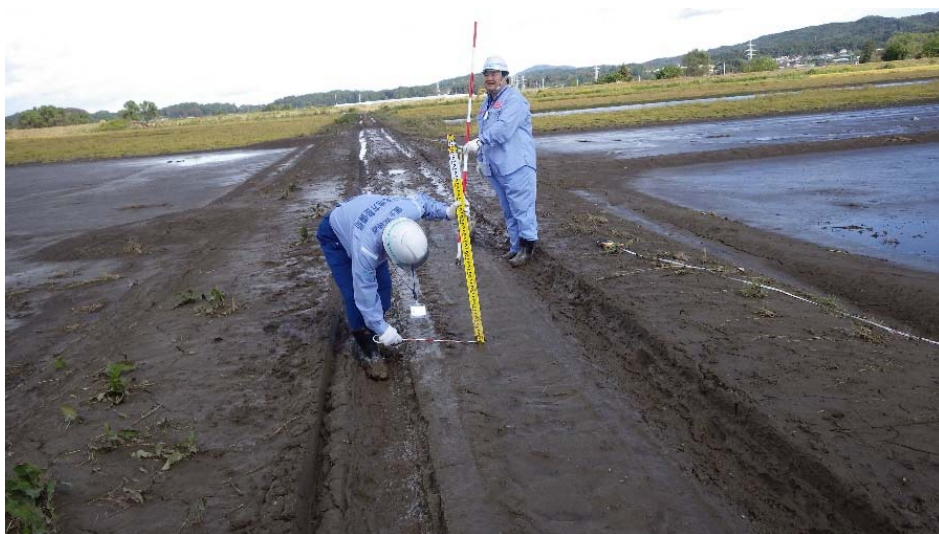
町道の土砂堆積状況を調査