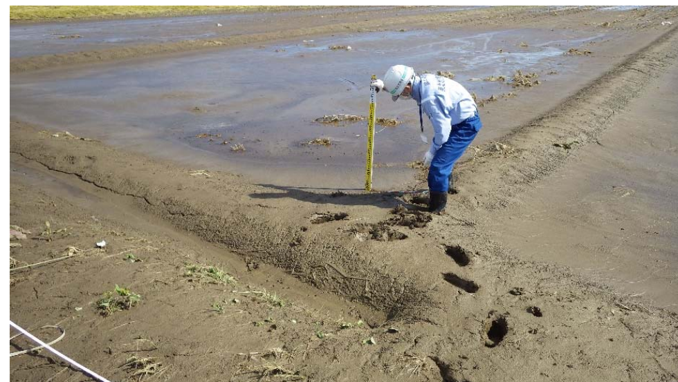
農地、水路の堆積状況 (厚さ10~20センチで広範囲に堆積)