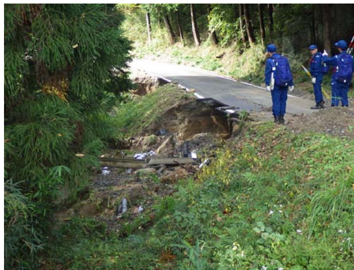
被災状況調査状況 宮城県角田市 小原田川 被災状況(路肩崩落)