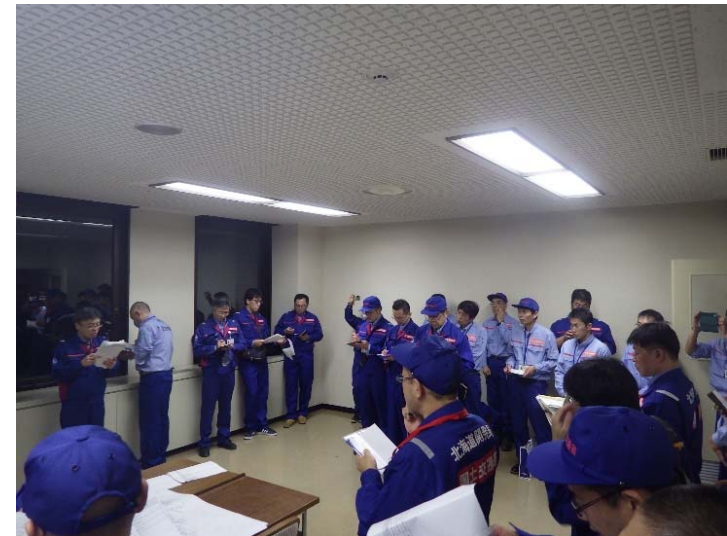
TEC全体打合わせ状況 (宮城県丸森町役場)