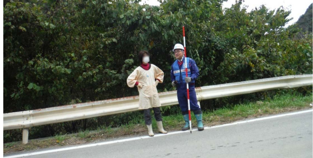
被災状況調査状況 (福島県相馬市中井塚 R115号)