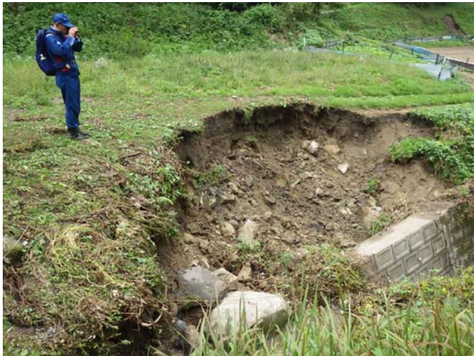
被災状況調査状況 宮城県角田市 山田沢川 被災状況(レーザー計測器による計測)