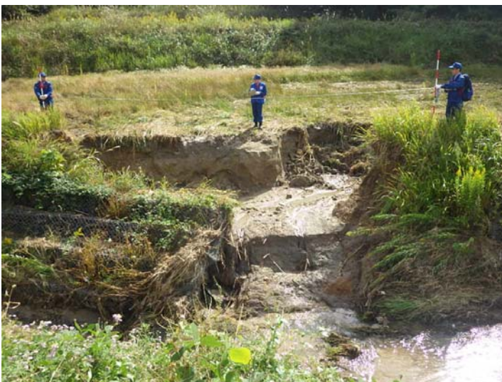
被災状況調査状況 宮城県角田市 小原田川 被災状況(河岸洗掘)