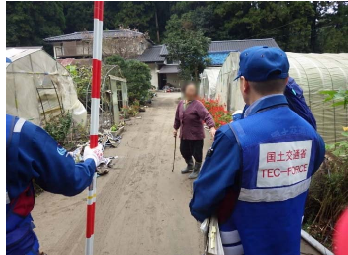
被災状況調査状況 宮城県角田市 山田沢川 被災状況(住民から情報収集)