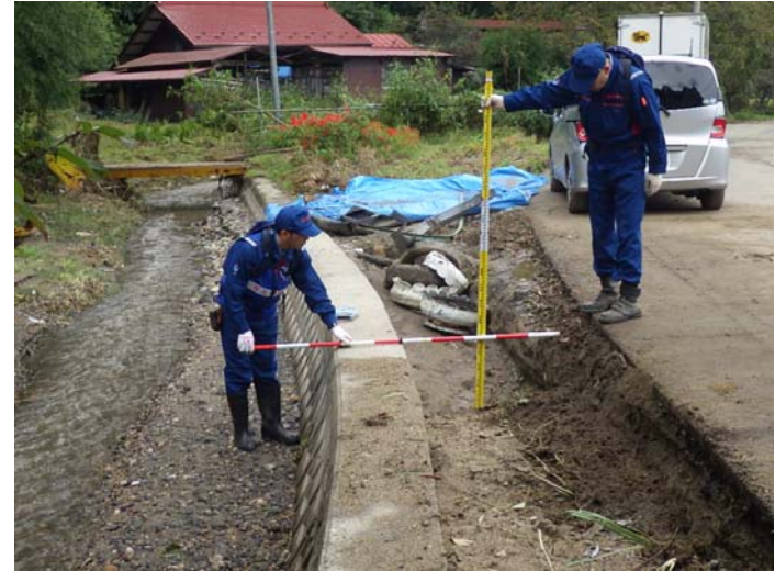
被災状況調査状況 宮城県角田市 山田沢川 被災状況(護岸背面流出)