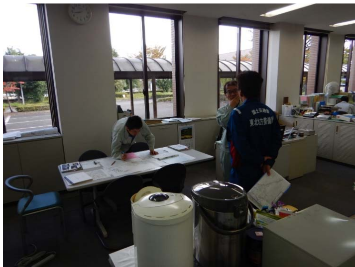
関係者との打合せ (福島県白河市表郷庁舎)