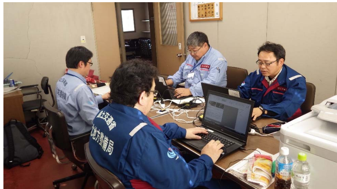
調査報告書作成 福島県田村郡三春町