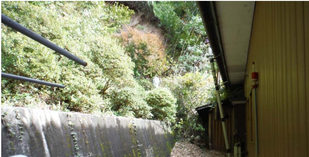
被災状況調査状況 (福島県相馬市山上字落合 R115号)