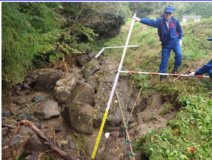
被災状況調査状況 宮城県角田市 小原田川 被災状況(河岸洗掘)