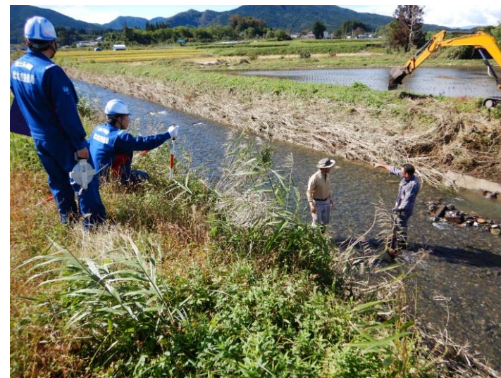
現地住民からの聞き込み (福島県白河市 坂下川)