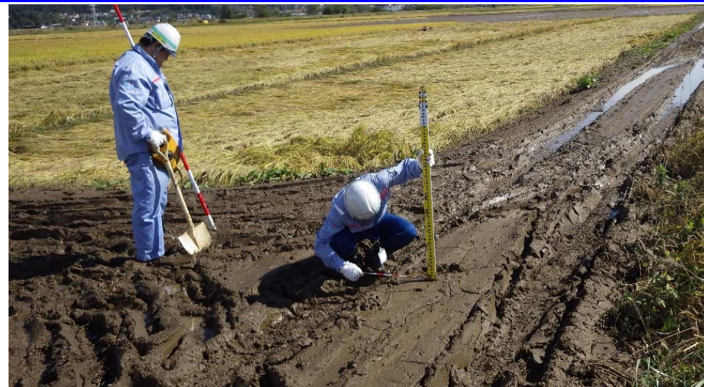
堆積土砂は厚さ10センチ程度。広範囲に堆積