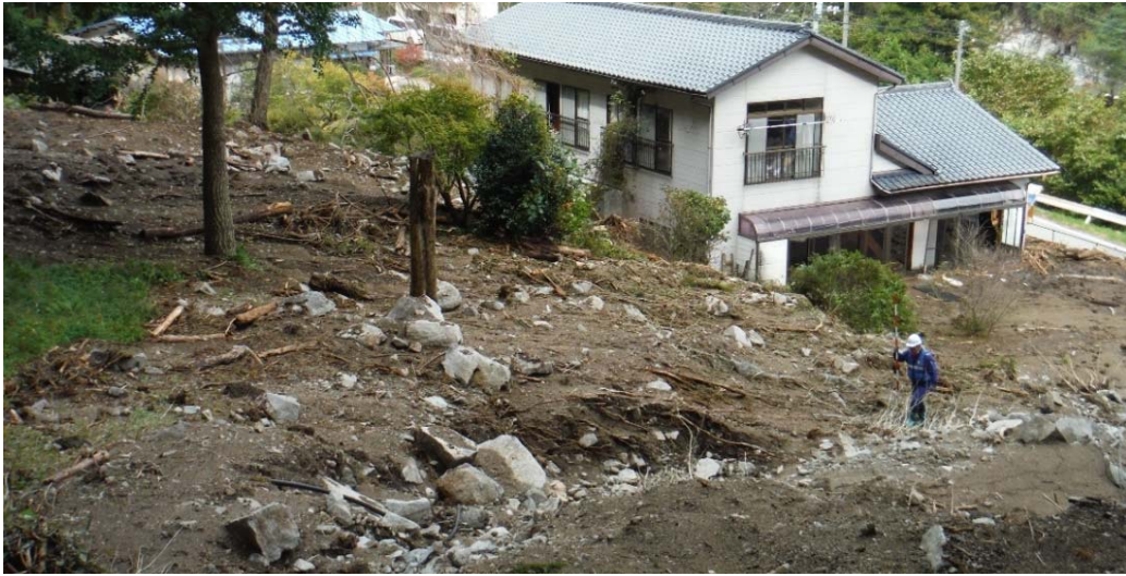
被災状況調査状況 (福島県相馬市中井塚 R115号)