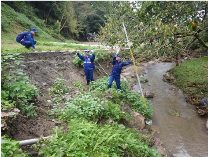
被災状況調査状況 宮城県角田市 山田沢川 被災状況(河岸洗掘)