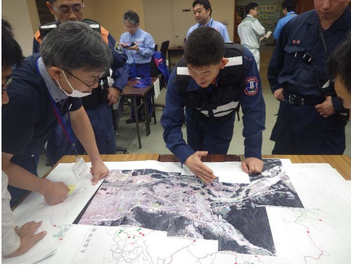
現地司令部と関係機関との調整状況 (宮城県丸森町役場内)