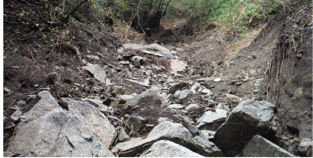
被災状況調査状況 (福島県相馬市中井塚 R115)