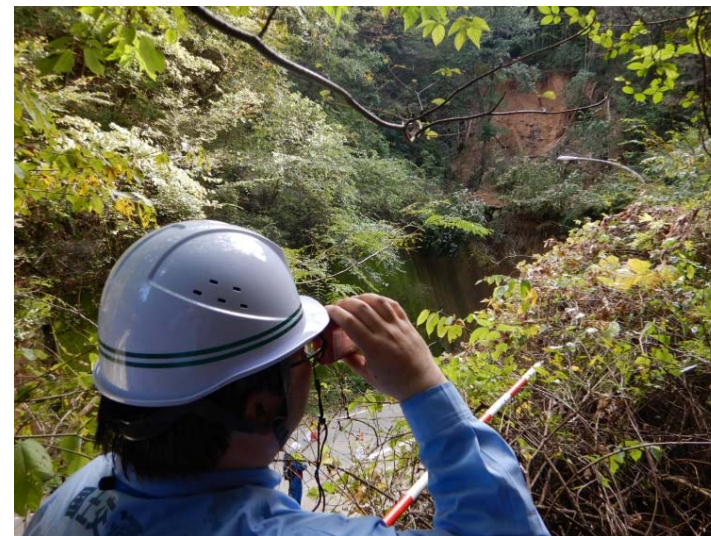
被災状況調査状況 レーザ測定機を使用した比高差確認 (福島県白河市 舍利石トンネル(市道))