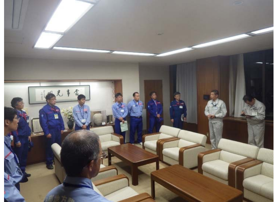
丸森町長との挨拶状況 (宮城県丸森町役場)