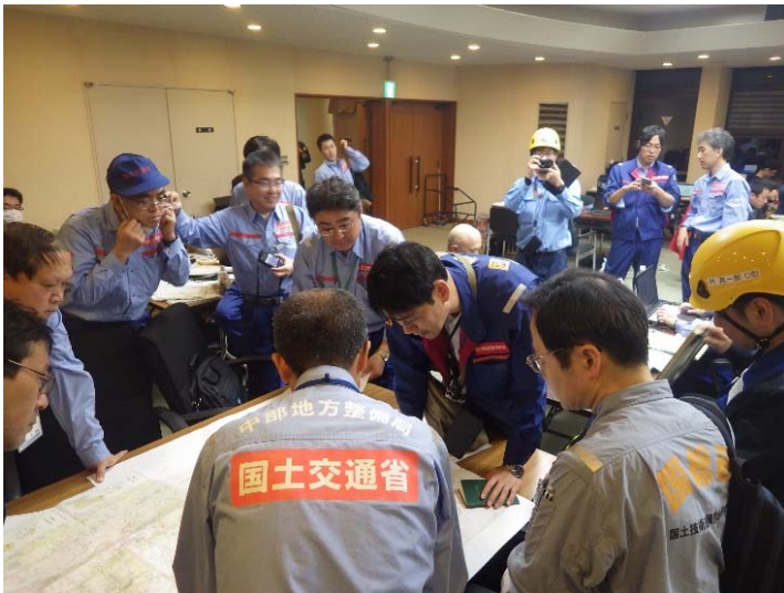
国総研との打合わせ状況 (宮城県丸森町役場)