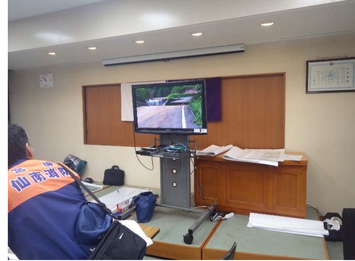
KU-SATを利用した現地映像確認 (宮城県丸森町役場内)