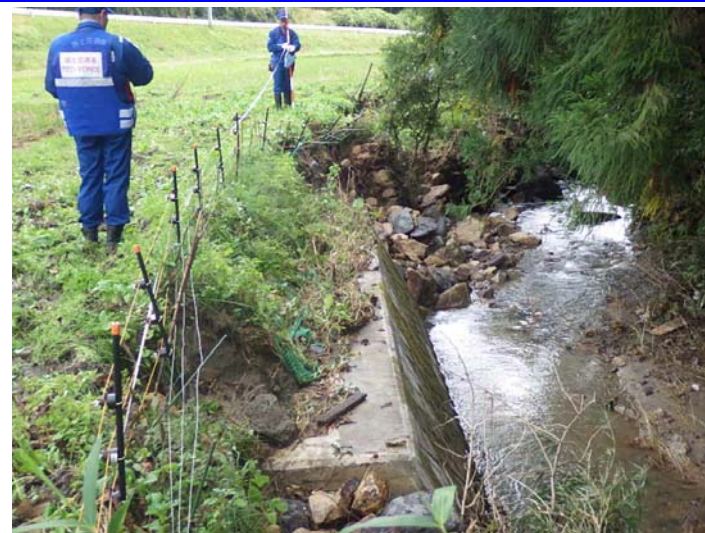
被災状況調査状況 宮城県角田市 小原田川 被災状況(河岸洗掘)