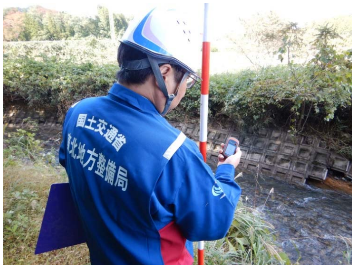
被災状況調査状況 GPSを用いた座標確認 (福島県白河市 坂下川)