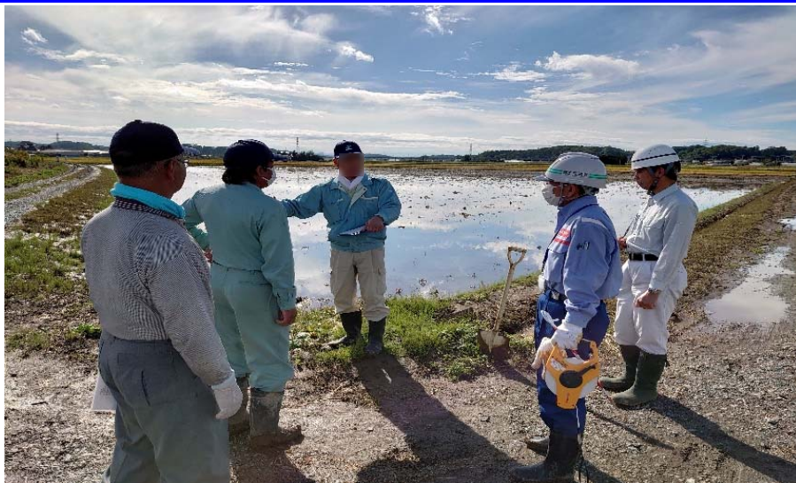
氾濫による堆積物調査を実施 土地改良区地区会長から堆積範囲を聞き込み