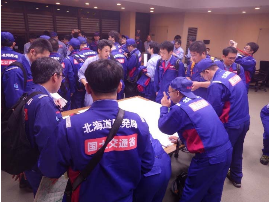
TEC全体打合わせ状況 (宮城県丸森町役場)