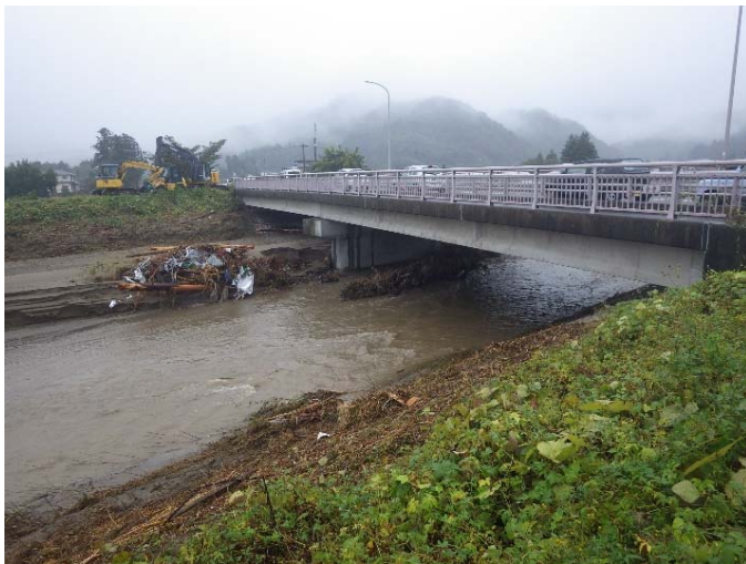
現地(五福川)確認状況 (宮城県丸森町五福谷橋付近)