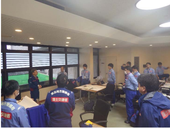
現地司令部とTEC班間の打合せ状況 (宮城県丸森町役場内)