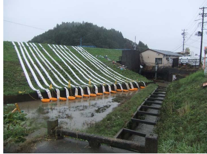
現地排水ポンプ設置状況 (宮城県丸森町たけや橋付近)