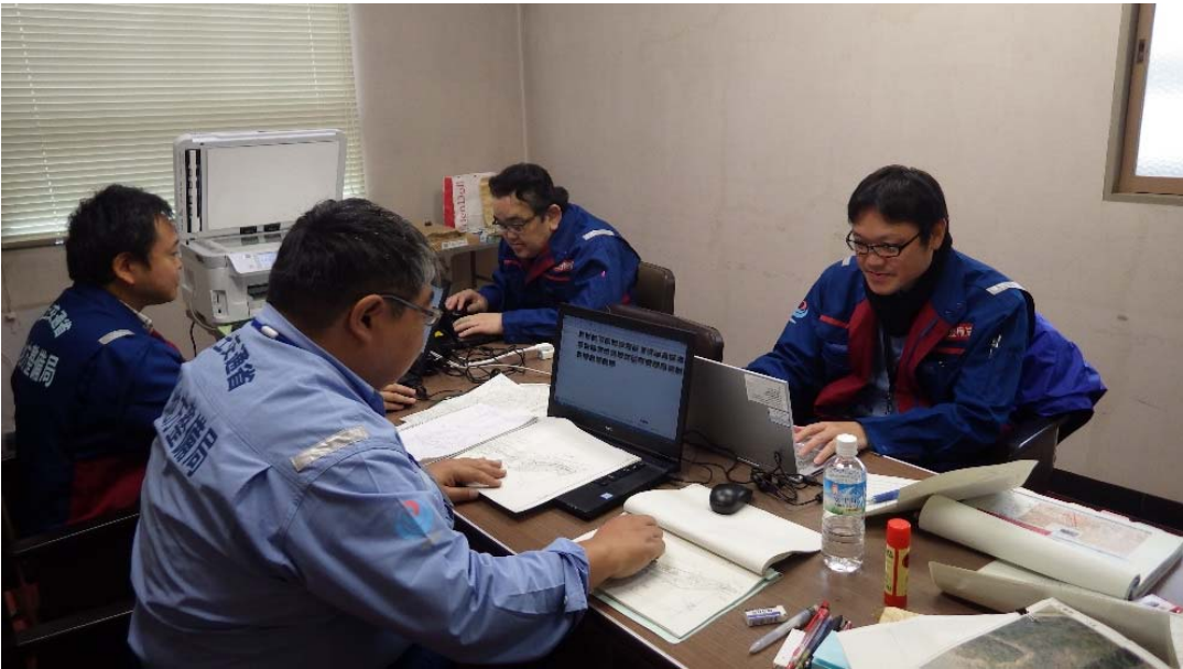
調査報告書作成 福島県田村郡三春町