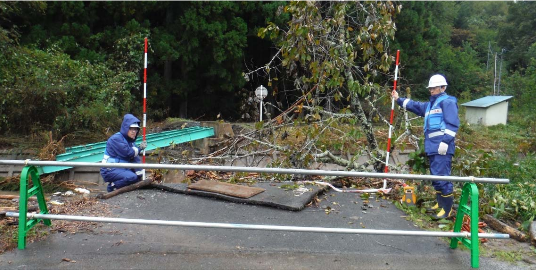
被災状況調査状況 (福島県相馬市 市道3012)