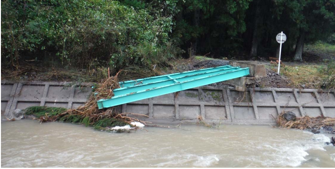
被災状況調査状況 (福島県相馬市 市道3012)