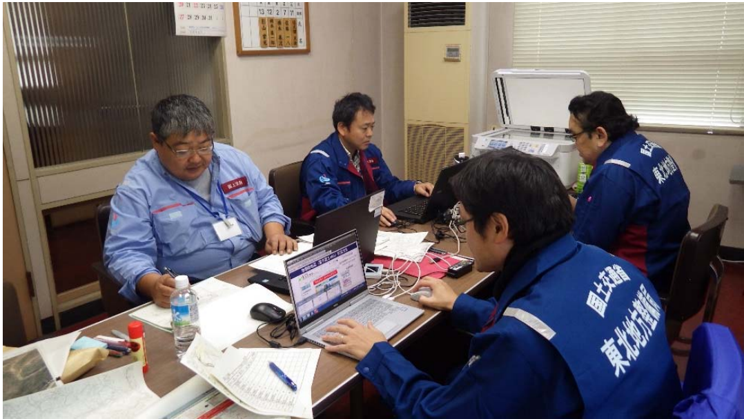
調査報告書作成 福島県田村郡三春町