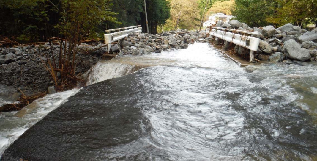
被災状況調査状況 (福島県相馬市 市林道 坂下新宿線)