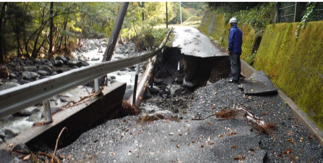
被災状況調査状況 (福島県相馬市 市林道坂下新宿線)