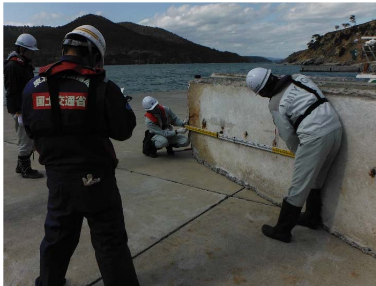
倒壊した上部パラペットの状況確認