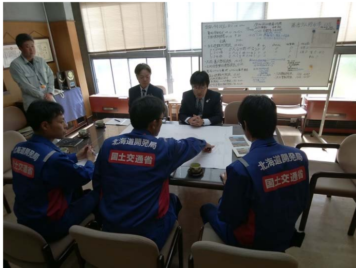
桑折町担当者と調査箇所打合わせ (福島県桑折町役場)