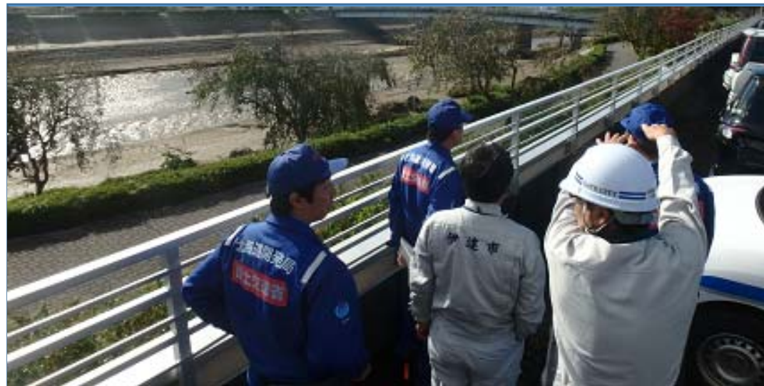
被災状況調査状況 (福島県伊達市 広瀬川)