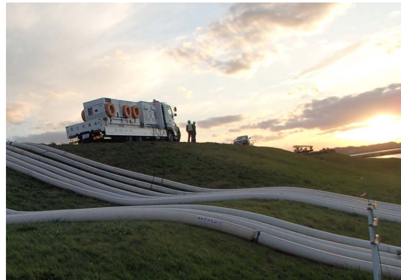
応急対策班 鳴瀬川水系吉田川 排水ポンプ車による排水作業を実施