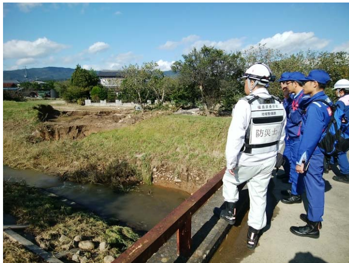
被災状況確認(佐久間川破堤箇所) (福島県伊達郡桑折町伊達崎地区)