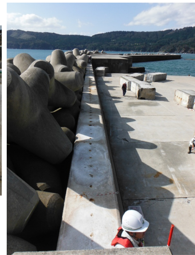
金華山港防波堤被災状況