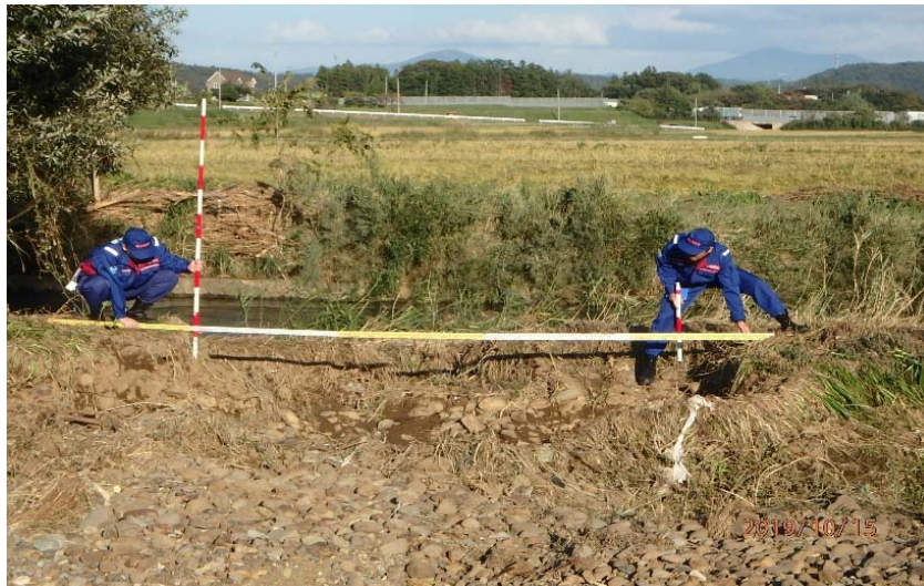
被災状況調査状況 (本宮市 阿武隈川水系安達太良川)