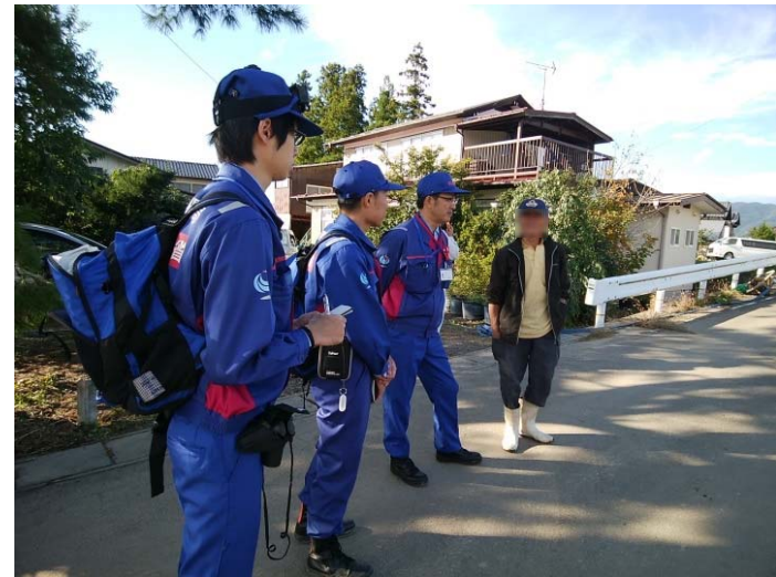
現地住民からの聞き込み (福島県伊達郡桑折町伊達崎地区)