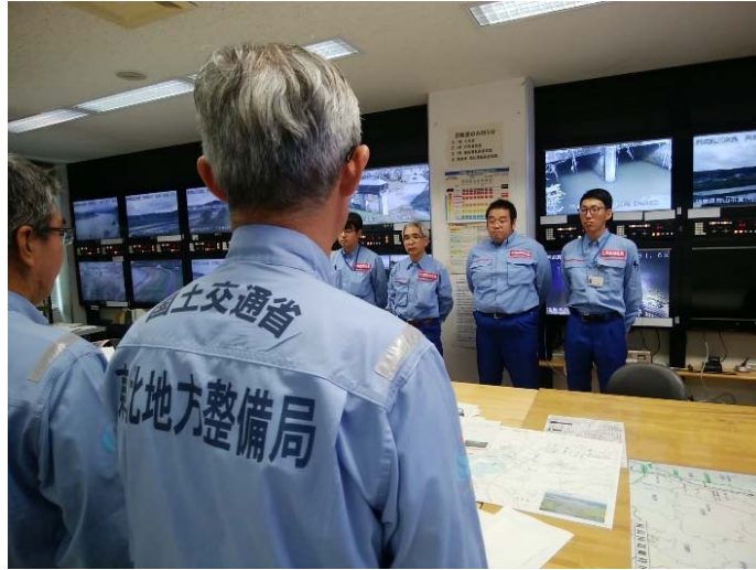
福島河川国道事務所との打合せ (福島県川俣町役場)