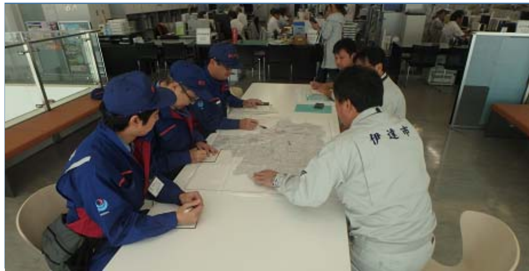
伊達市担当者との打ち合わせ