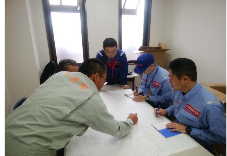
打ち合わせ (本宮市役所)