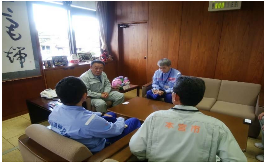
本宮市長に挨拶 (本宮市役所)