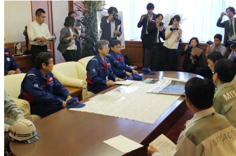
△宮城県知事室 全景

【日 時】令和元年10月15日（火）15:45～ 【場 所】宮城県行政庁舎 4階 知事応接室 【報告者】東北地方整備局（本部排水支援チーム、TEC-FORCE、リエゾン）3名 排水作業業者4名（計7名）