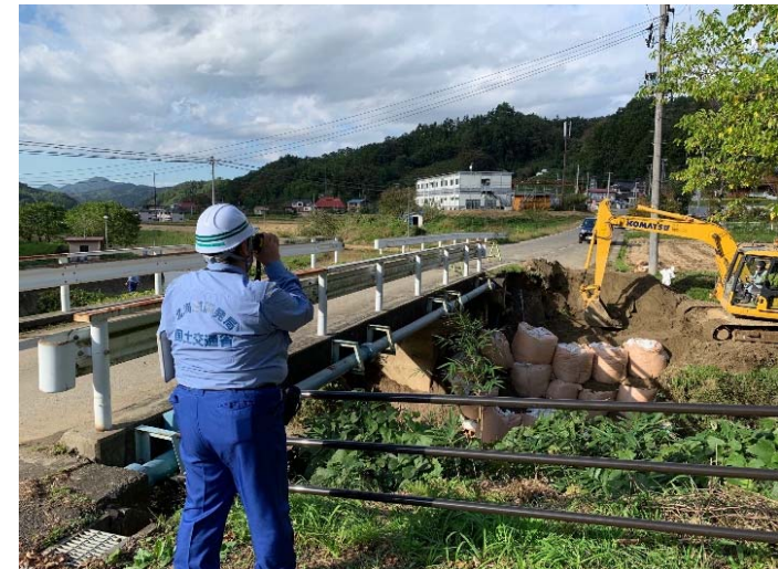
被災状況調査状況 (福島県伊達郡川俣町小綱木 高根川・高根橋)