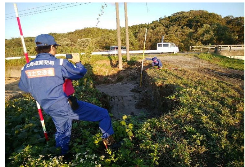
被災状況調査状況 (本宮市 阿武隈川水系五百川)