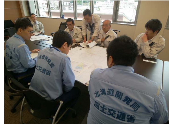
川俣町役場との打合せ (福島県川俣町役場)