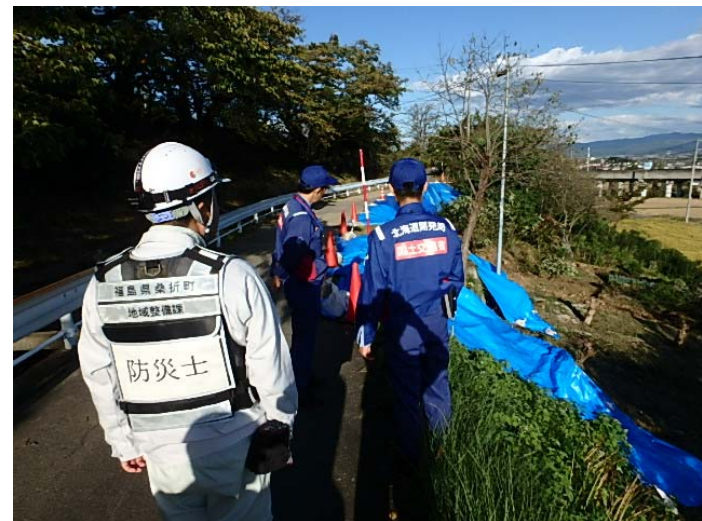
被災状況確認(道路被災箇所) (福島県伊達郡桑折町成田地区)