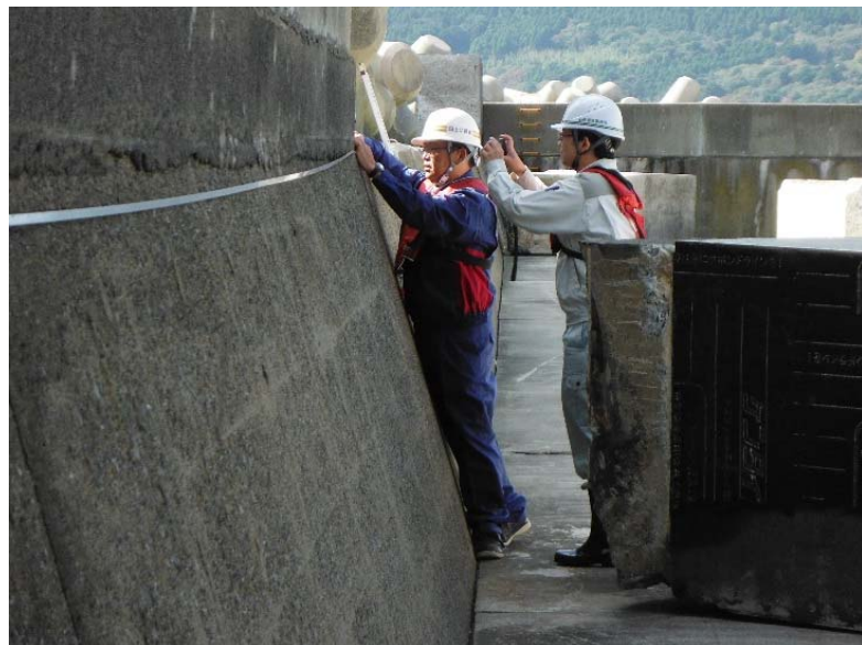
金華山港被災現場状況調査(計測)