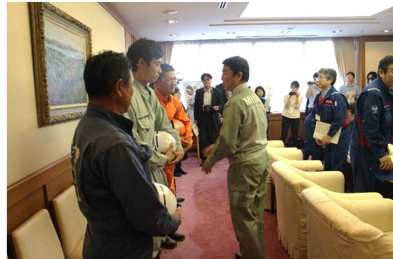
△排水作業業者への御礼