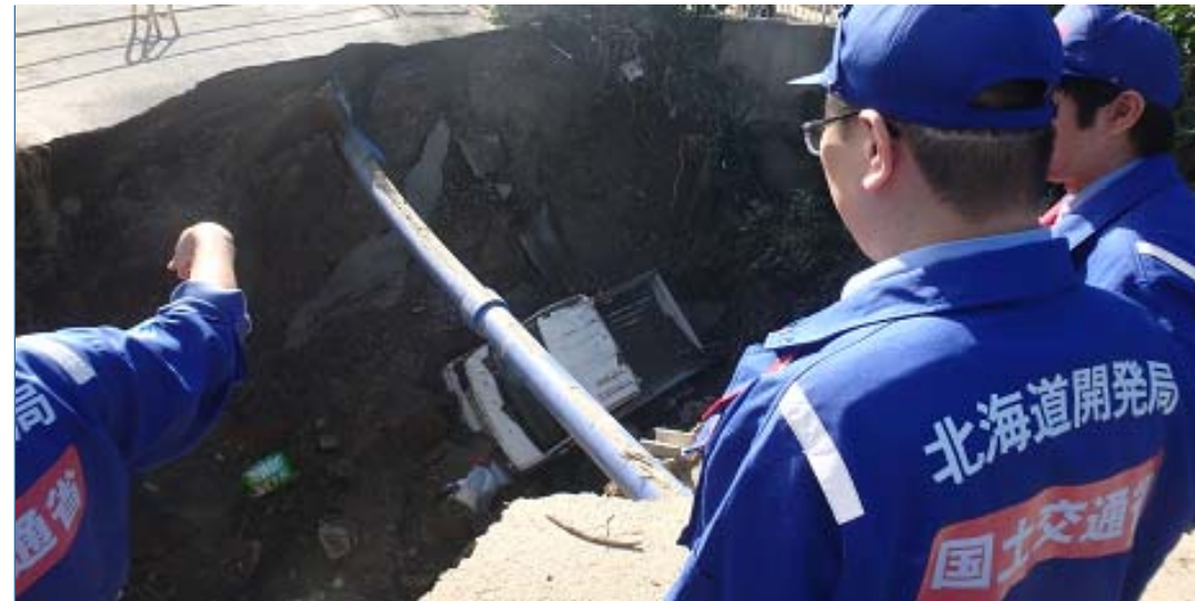
被災状況調査状況 (福島県伊達市梁川町五十沢)