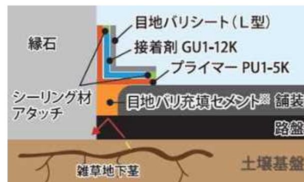
【目地バリシート(L型)】

※目地バリ充填セメントは、目地が10mm以上開いている、または多年生雑草が発生している場合に使用。