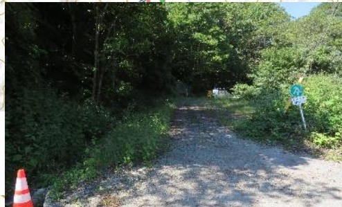
実証実験場所 明戸林道