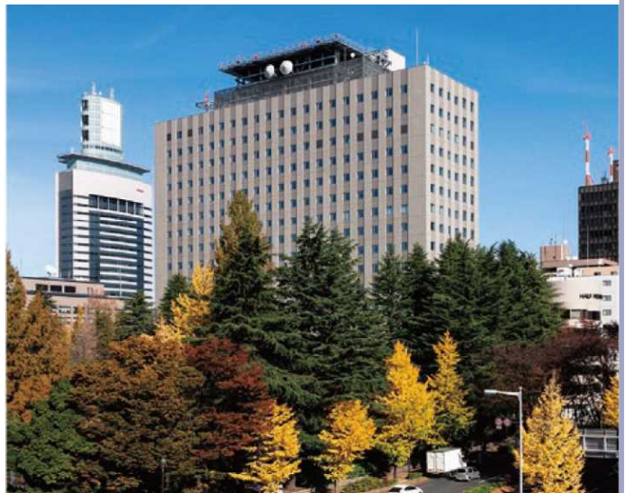
▲東北地方整備局(仙台合同庁舎B棟)

青森県、岩手県、宮城県、秋田県、山形県、福島県を管轄し、道路、河川、ダム、砂防、港湾、空港施設等の整備及び維持管理、建設業や不動産業の許認可に関する業務等を実施。