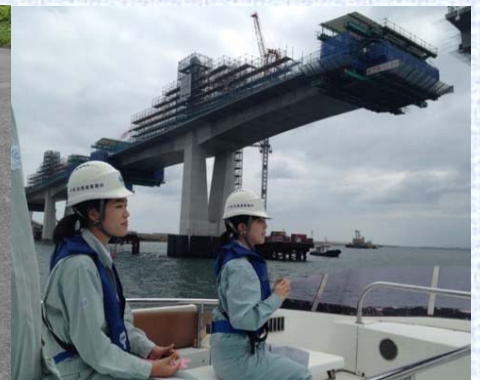
【小名浜港橋梁建設現場】