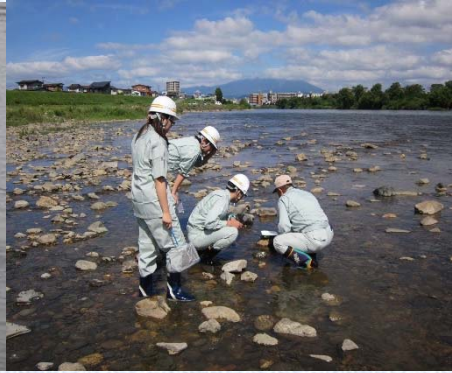
【中津川水生生物調査】