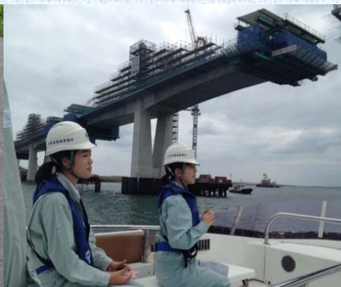
【小名浜港橋梁建設現場】