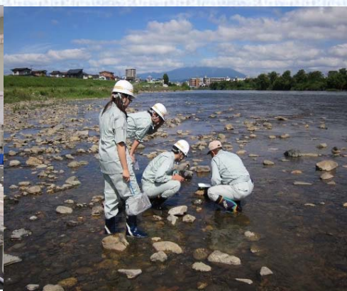
【中津川水生生物調査】