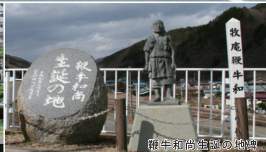
鞭牛和尚誕生の地碑