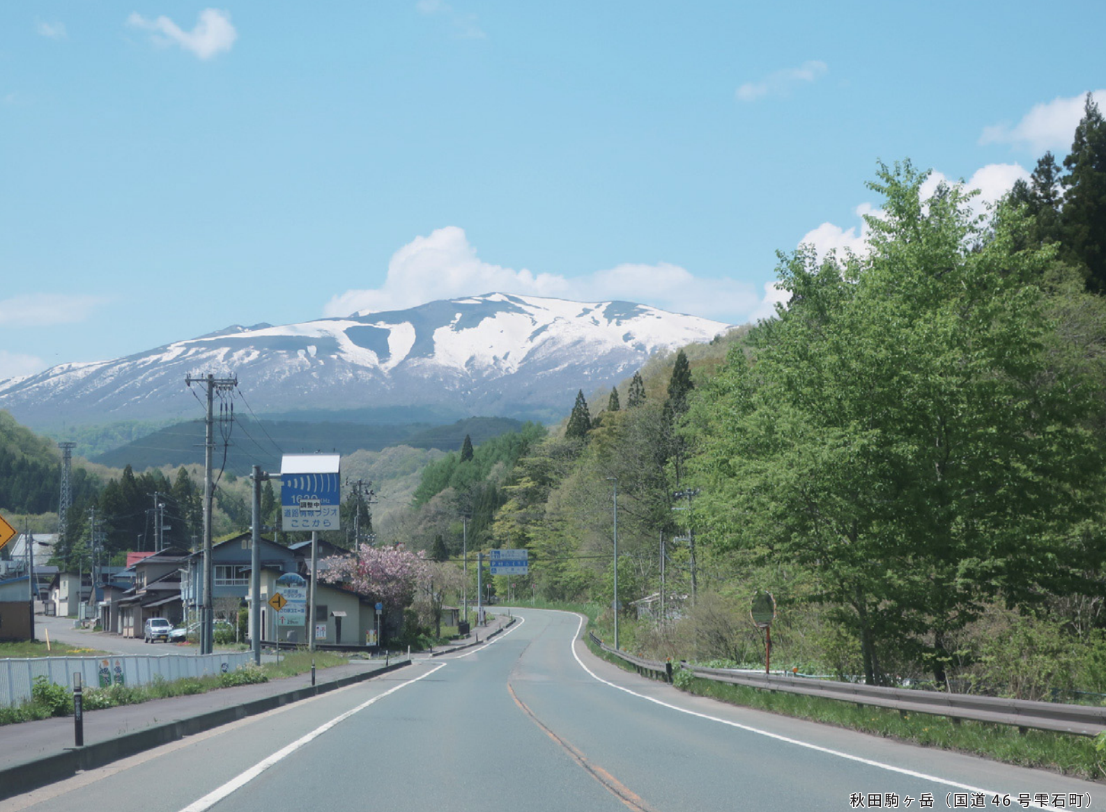
秋田駒ヶ岳（国道46号雫石町）