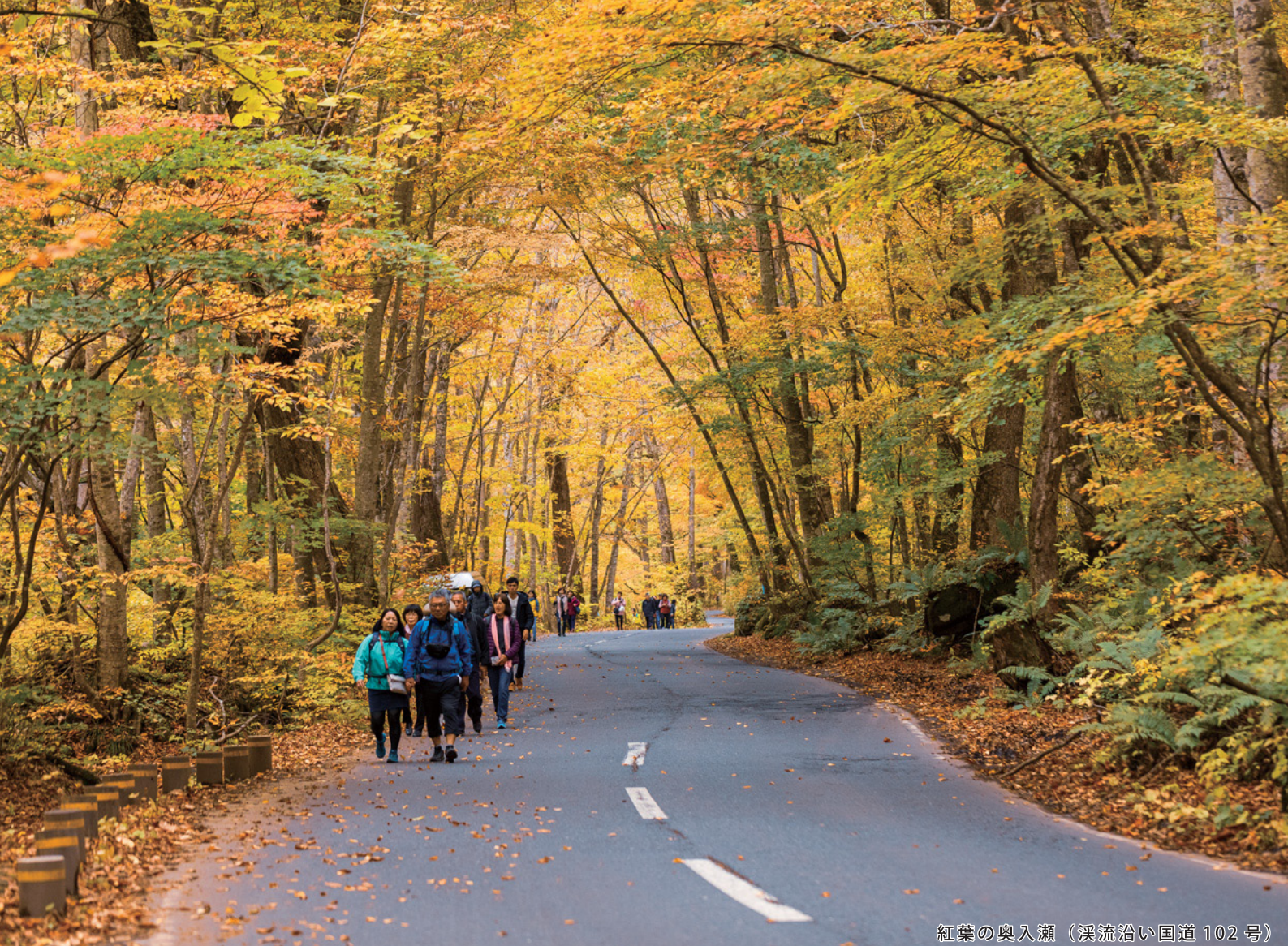
紅葉の奥入瀬（溪流沿い国道102号）