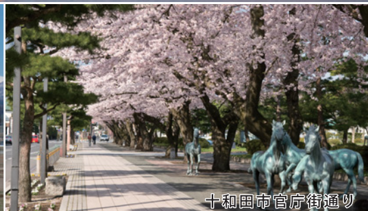
十和田市官庁街通り