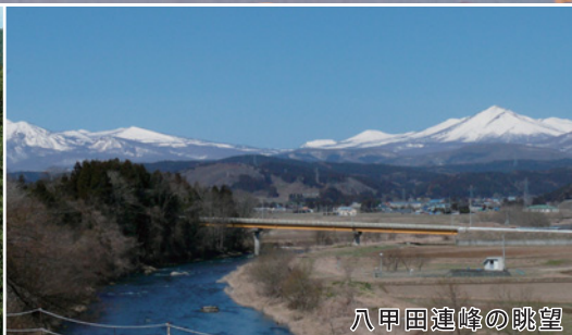
八甲田連峰の眺望